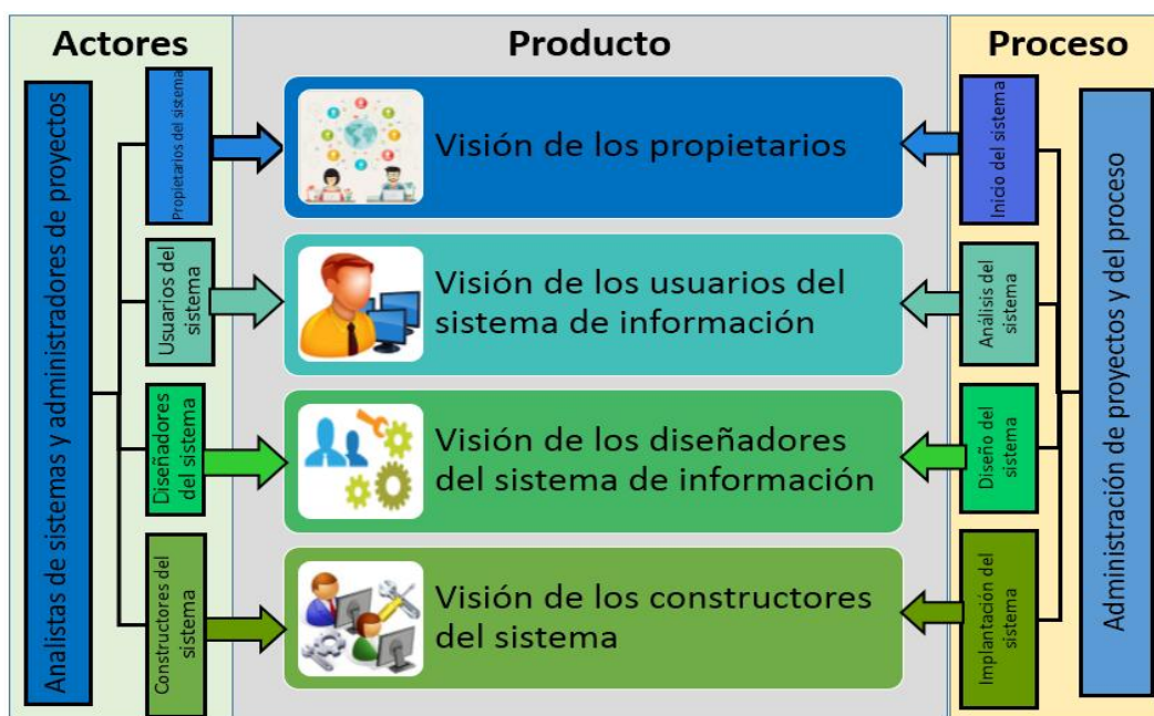
Figura 2. Perspectiva de los involucrados sobre un sistema de información